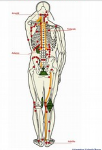
Points de Knap - Face postérieure

Découverte des Points de Knap (Yolande Buyse naturopathe nutritionniste)