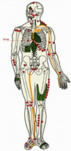
Points de Knap - Face antérieure